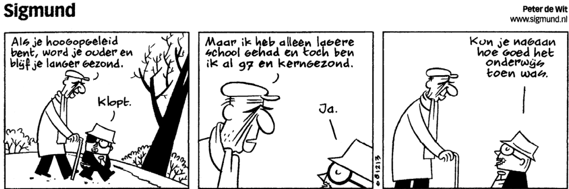
figuur 2 Sigmund

Sigmund trekt in het derde plaatje de volgende conclusie: De man is oud geworden en lang gezond gebleven, dus hij moet wel hoogopgeleid zijn, oftewel: O \Rightarrow H .