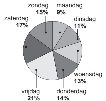
omzet alle snackbars in Nederland

→ Bereken hoeveel euro alle snackbars in Nederland per jaar op zaterdag en zondag samen omzetten. Schrijf hieronder je berekening op.